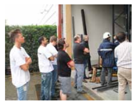
De precieze plaatsing van de kraan zorgde voor mooie en spectaculaire beelden waar onze medewerkers getuige van konden zijn!

Hoewel de vierde gang nog niet volledig gevuld is, merkten we al na de eerste week een positief resultaat in het aantal pickings per uur: +10% .