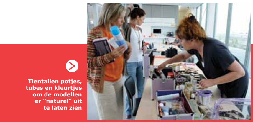
Tientallen potjes, tubes en kleurtjes om de modellen er "naturel" uit te laten zien