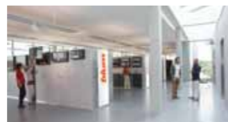
⬅ De Blum Showroom in het Van Hoecke Competence Center te Sint-Niklaas