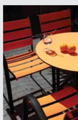
Jan Dirx (fotograaf van de VHCC fotoshoot zie p. 6-7)