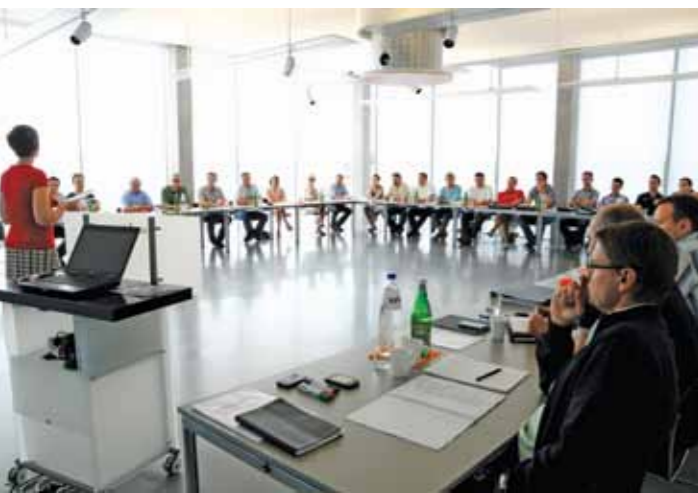
Tijdens de workshop van groep 1 was het auditorium goed gevuld