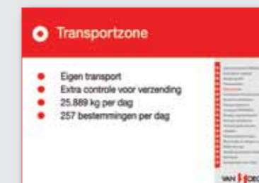
Het infobord aan de transportzone