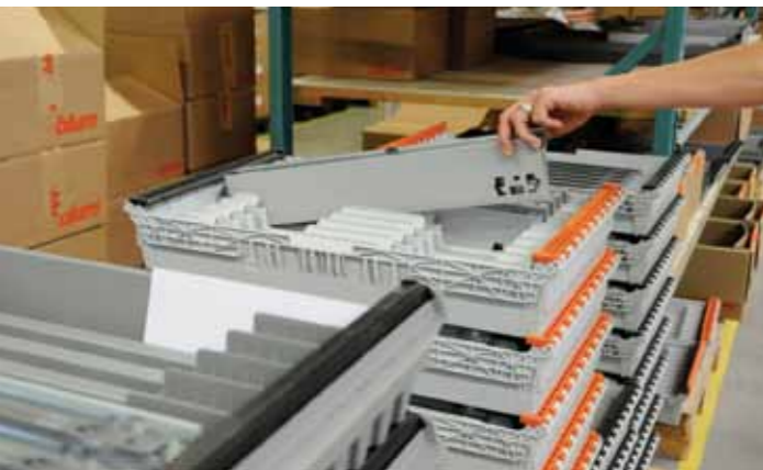
Van Hoecke en Halux proberen, overal waar mogelijk, deze Ecopacks te gebruiken

Door het ingenieuze 'eierkartonprincipe' kan men na gebruik de lege Ecobox omkeren en stapelen. Hierdoor halveert het stapelvolume.