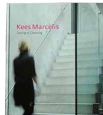
Je kan Seeing is creating inkijken in de beide Van Hoecke vestigingen

Zijn nieuwe en bijzonder sfeer- vol uitgevoerde boek omvat vijftien bijzondere, inspirerende nationale en internationale projecten. Zijn vernieuwende en innovatieve eenvoud komt perfect naar voren in de getoonde projecten, die variëren van een grote villa in Luxemburg, een restaurant in de bossen bij Arnhem tot een skybox in een voetbalstadion. Ook ons gebouw komt in het boek nadrukkelijk aan bod.