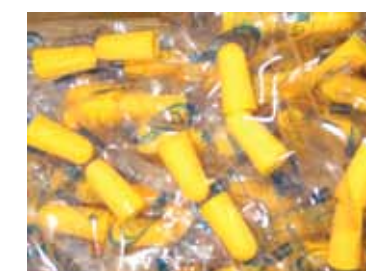
Voor onze uitzendkrachten stellen we wegwerpoordopjes ter beschikking