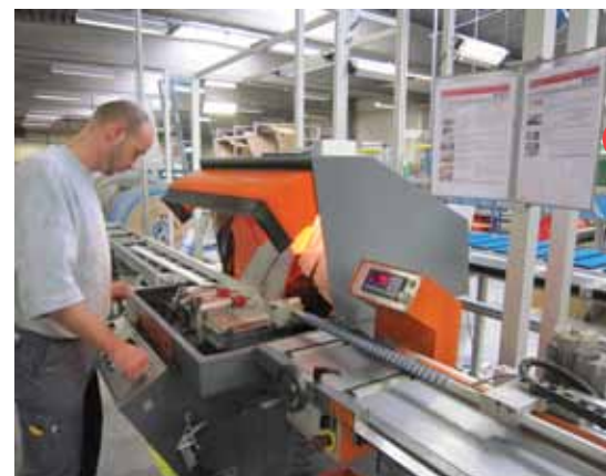
Intussen hangen al werkinstructies in de ALU afdeling