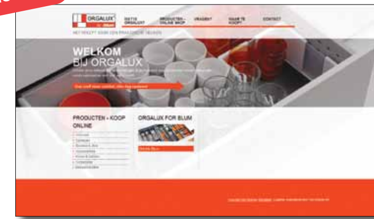
Screenshot van de nieuwe ORGALUX homepage

De bezoeker kan inspiratie opdoen via foto's die tonen wat ORGALUX te bieden heeft. Maar wie wil, kan kenmerken en prijzen van individuele producten opzoeken. De website zal een verlanglijstje kunnen bijhouden. Daar kan de klant mee naar zijn dealer of schrijver stappen om de gepaste ORGALUX producten verder te bespreken.