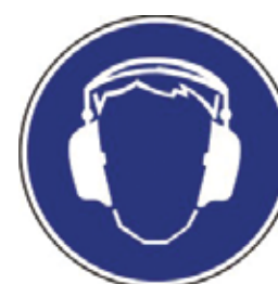
Aan de hand van dit gebodsbord maken we duidelijk dat gehoorbescherming verplicht is

Sowieso beschikken alle productiemedewerkers al geruime tijd over gehoorbeschermingsmiddelen. Voor onze vaste medewerkers laten we oordopjes op maat maken - ook otoplastieken genoemd. Aan onze uitzendkrachten stellen we wegwerpoordopjes ter beschikking.