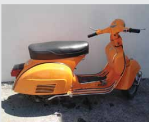
Dieter Guinée Oranje Vespa gefotografeerd in Zuid-Frankrijk