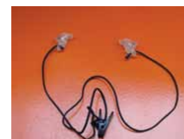
Al onze medewerkers hebben oordopjes die op maat gemaakt zijn - ook wel otoplastieken genoemd