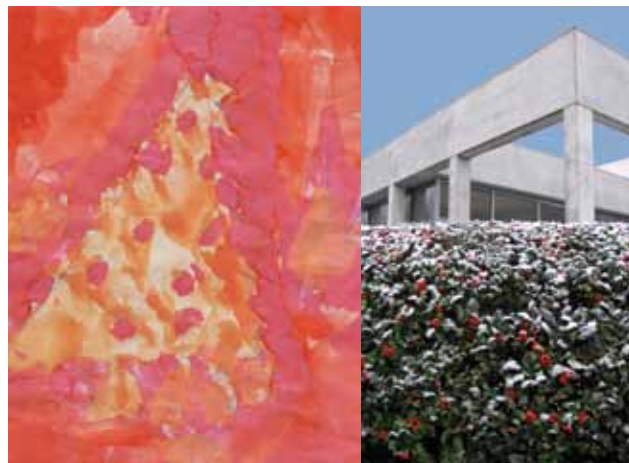
▲ Kersttekening gemaakt door Rachal Akondo