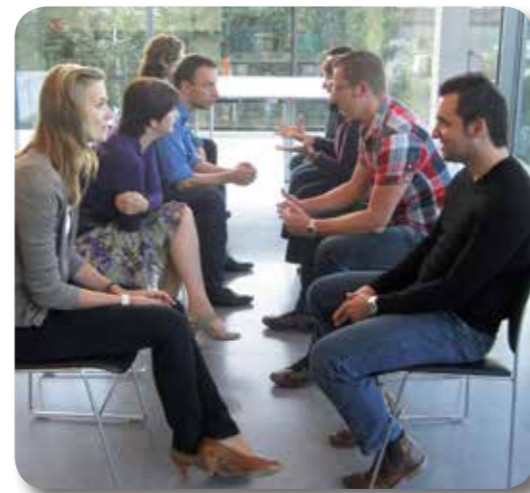
Tijdens de inleiding van de workshop beantwoordden de deelnemers in duo's vragen om zo tot een juister eigenbeeld te komen

De medewerkers van het magazijn en de commerciële binnendienst namen in oktober deel aan de derde ORION workshop. Ditmaal stonden de eigen capaciteiten en verbeterpunten in hun functies centraal.