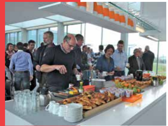
Na de lange busrit wachtte de deelnemers een ontbijtbuffet