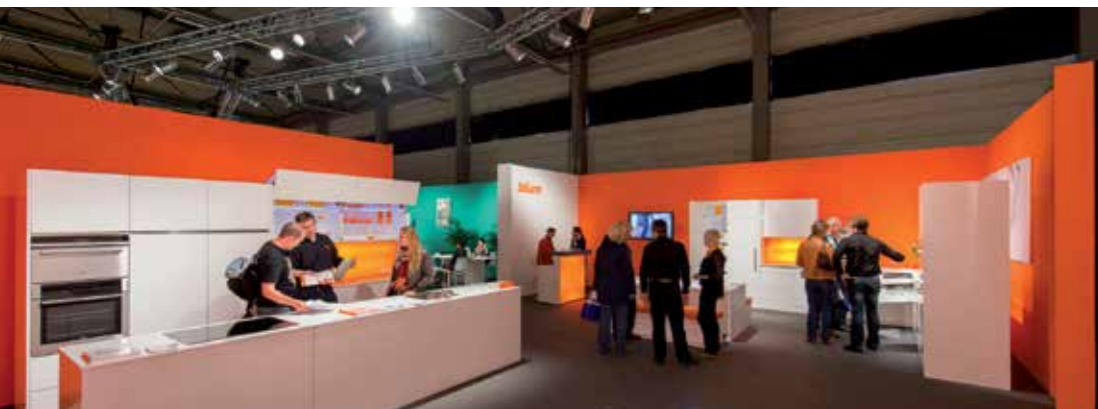
⬆ Onze stand op BIS in sfeervol wit en oranje

Vandaag zijn de genietroepen peter van verschillende tehuisen en centra voor hulpbehoevenden. Om hen te bedanken voor hun inzet organiseert de Stad Sint-Niklaas jaarlijks een bedrijfsbezoek. Op dinsdag 20 augustus 2012 kregen wij deze bijzondere delegatie over de vloer voor een rondleiding in de Blum Showroom, het magazijn en Halux.