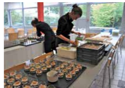
'Crème de la Crème' stond in voor de lekkere hapjes