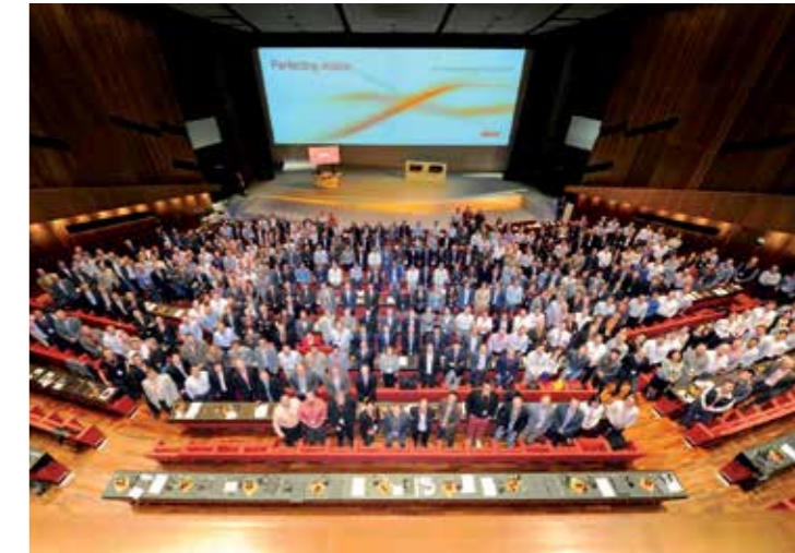
Indrukwekkend in hoeveel landen Blum vertegenwoordigd is

Het tiende Blum Forum werd afgesloten met een groot feest waarop banden werden gesmeed tussen collega's onderling en met de medewerkers van Blum. Banden die in de toekomst onze samenwerking nog een extra dimensie zullen geven.