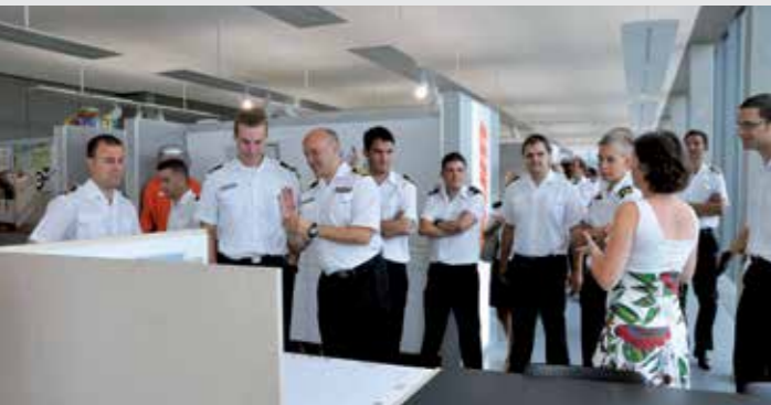
⬅ Enkele maanden geleden waren zij nog te gast in de Blum Showroom, vandaag bestrijden de mariniers van de Louise-Marie piraten in Somalië