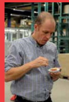
Jo smult van de hapjes