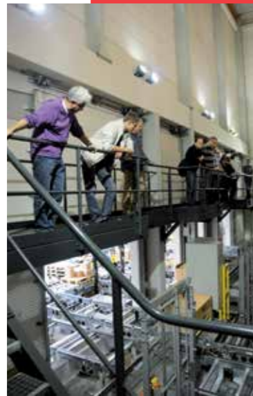
Een blik achter de schermen van het automatische magazijn

Rond tien uur 's morgens arriveerden ze in Sint-Niklaas.