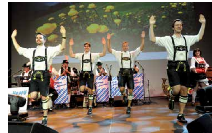
Dansers in lederhosen en dirndls vrolijkten de laatste avond op