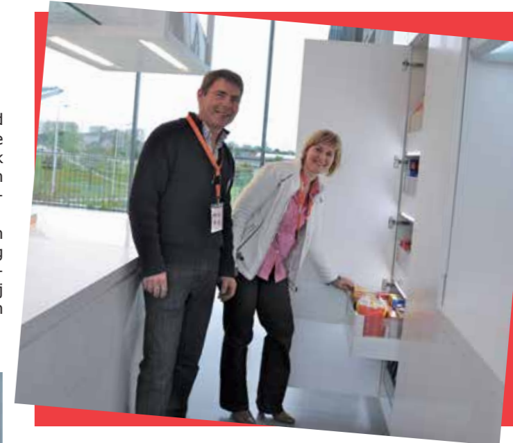
⬆ "Ons bezoek in enkele woorden samengevat: zeer interessant, goede ontvangst en professioneel advies!"