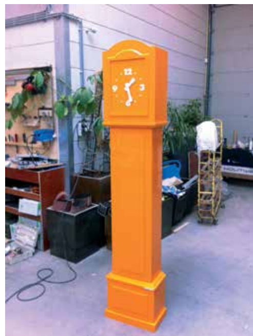
Jasper van Berkum-Bos bezorgde ons dit kiekje van een 'Blum oranje' klok