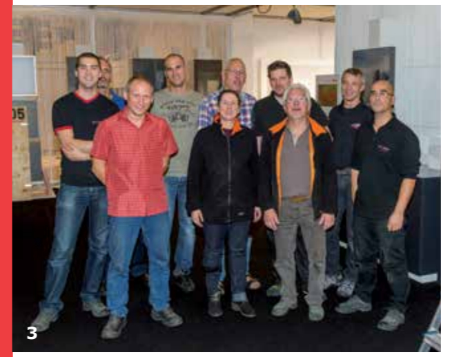
"Bedankt aan iedereen die rechtstreeks of onrechtstreeks betrokken was bij de organisatie van Prowood"